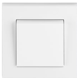
bílá / ledová bílá

Život, nejen s malými dětmi, je plný barevných variací. Může být klidný a harmonický, stejně tak jako výrazně kreativní. Design pestrý jako život, ať je kdekoliv.