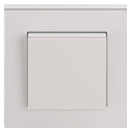
šedá / bílá