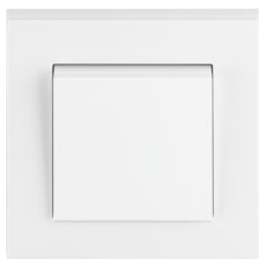
bílá / bílá